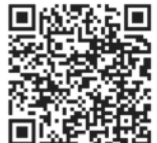
記載のしかたはこちら